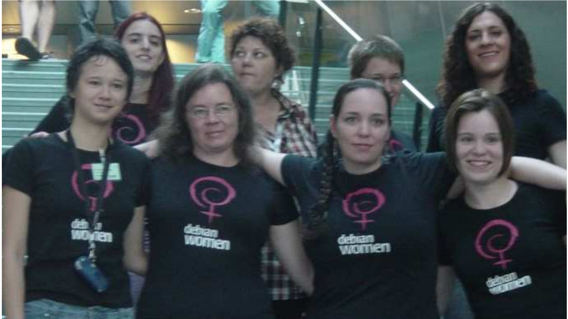
Helsinki, Julio 2005, Debconf5