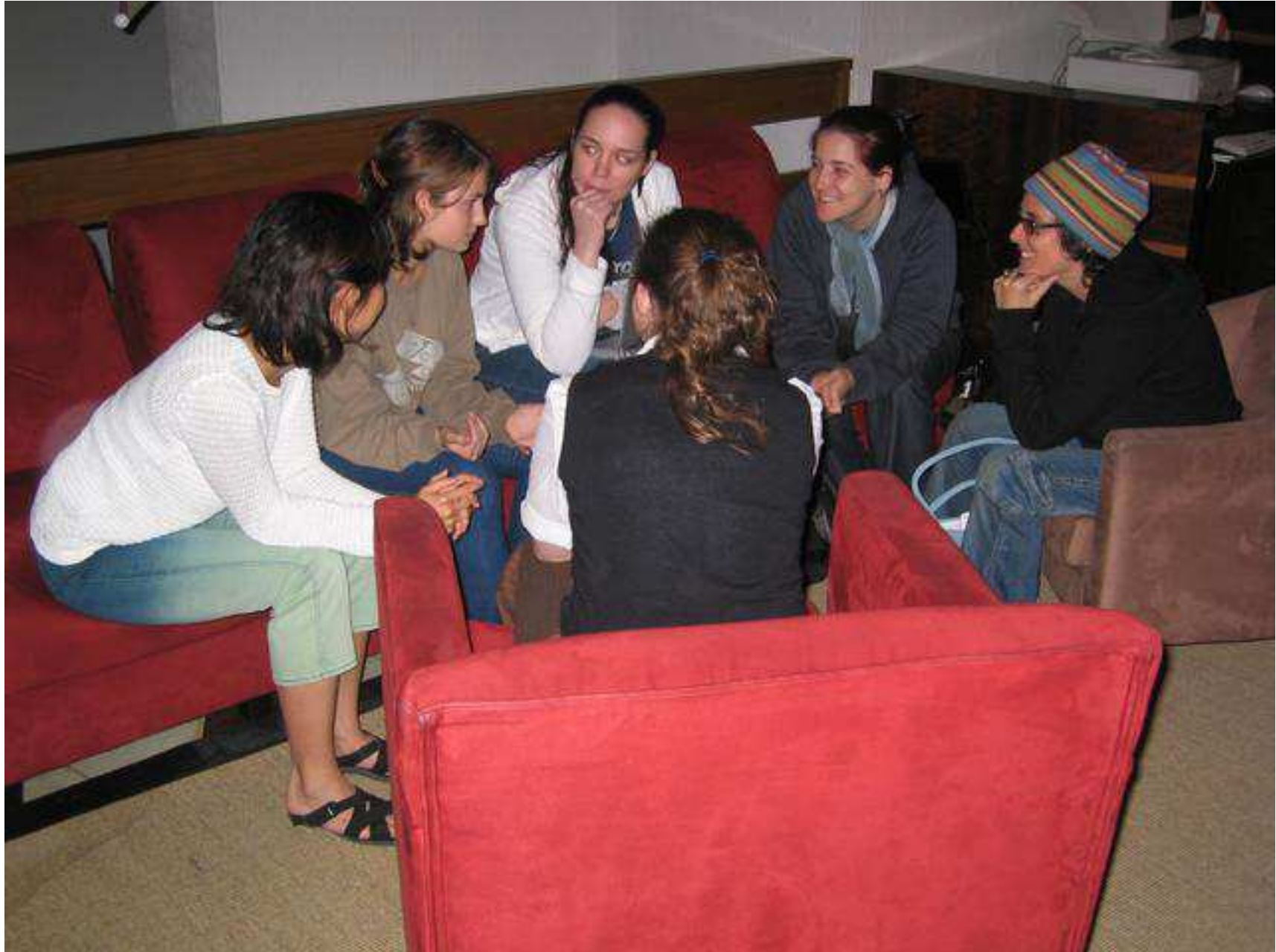
Porto Alegre, Brasil, Debconf4